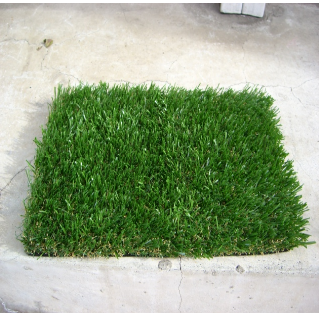
ナチュラルグリーンは天然芝に近い色合い