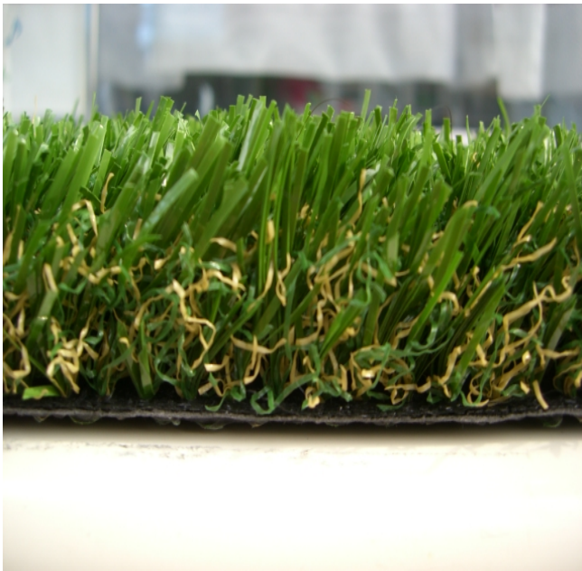
枯れた色の芝草をコンバインしたリアルな人工芝