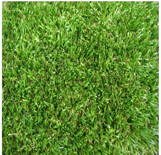
高密度によりクッション性を高める